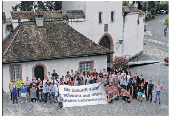
Zum guten Glück gibt es Betriebe in unserer Region und Gemeinde, die Jugendliche ausbilden.

Mit der Aktion führen die Baselbieter Gewerbe- und Industrievereine ihre Kampagne des vergangenen Jahres fort. Diese stand und steht unter dem Motto «Die Zukunft sähe schwarz aus ohne unsere Lehrbetriebe».